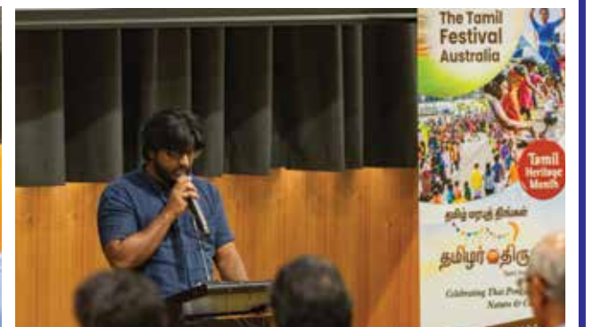
நன்றியுரை: திரு ச சத்தியன், தமிழ் மரபு அமர்வு ஆஸ்திரேலியா