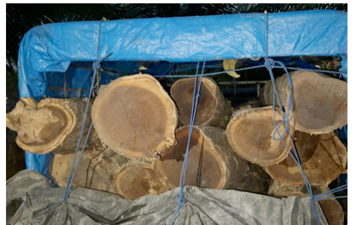
இந்தநிலையில் 13 தேக்கு மர குற்றிகள் பொலிஸாரால் கைப்பற்றப்பட்டன.

முல்லைத்தீவு, மார்ச் 11 புதுக்குடியிருப்பில் சட்டவிரோதமாகத் தேக்கு மர குற்றிகளை கடத்திச் சென்ற வாகனத்தின் சாரதி பொலிஸார் கைது செய்துள்ளனர். நேற்றுமுன்தினம் சனிக்கிழமை மாலை இந்த கடத்தல் சம்பவம் நடந்ததாக பொலிஸார் தெரிவித்தனர். புதுக்குடியிருப்பு பகுதியில் பட்டா ரக வாகனத்தில் தேக்கு மரகுற்றிகளை கடத்துவதாக புதுக்குடியிருப்பு பொலிஸாருக்கு கிடைத்த இரகசிய தகவலின் அடிப்படையில் சந்தேக நபர் கைதானார்.