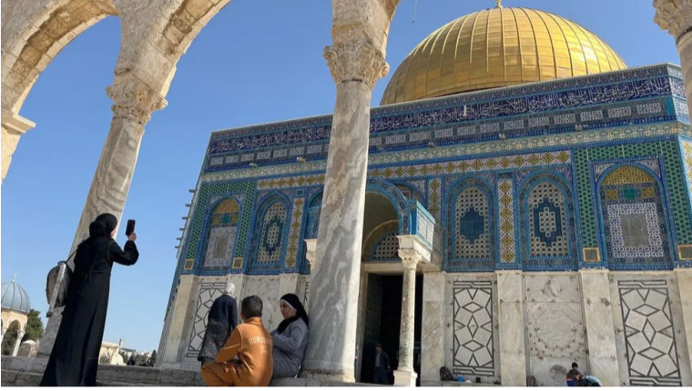
எகிப்தில் முன்னெடுக்கப்படும் ஹமாஸ் - இஸ்ரேல் பேச்சு ஒரு வாரம் ஒத்திவைக்கப்பட்ட

அல் - அக்லா பள்ளிவாசல் இஸ்லாமியர்களின் மூன்றாவது புனித ஆலயமாகும். ஆனால், இது யூத மதத்தினருக்கும் புனிதமான இடமாகும். இஸ்ரேல் - பலஸ்தீன் மோதல் ஏற்படும் காலத்தில் இந்தத் தலமும் முக்கியமான காரணியாக உள்ளது.