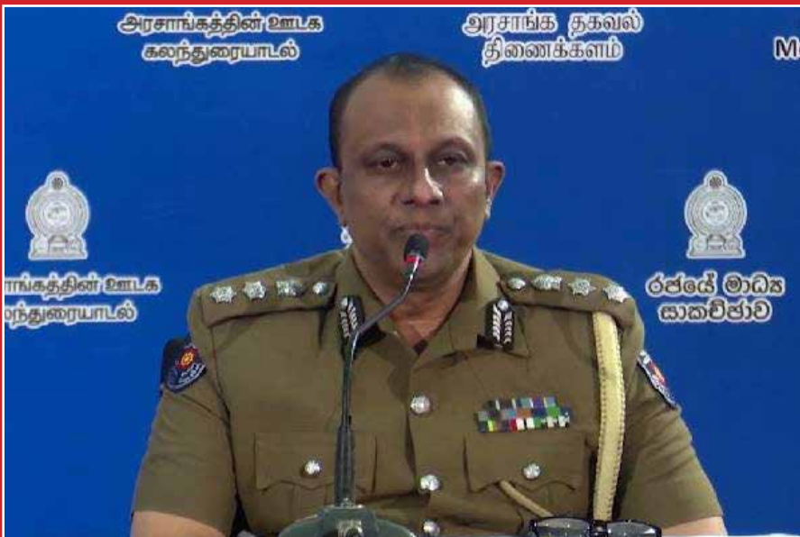
பாதாளக் குழுக்களை சேர்ந்த 43 பேருக்கு எதிராகச் சர்வதேச சிவப்பு அறிவிப்புகள் பெறப்பட்டுள்ளன என்று பொலிஸார் தெரிவித்துள்ளது.