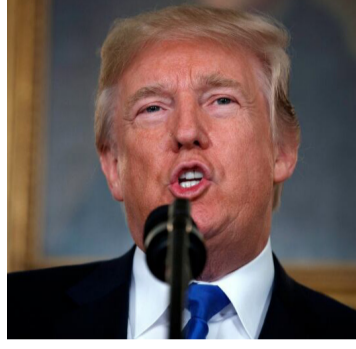
கரிக்கும் எனவும் ட்ரம்ப் குறிப்பிட்டுள்ளார்.

ரிக்ரொக்கினை தடை செய்வது மக்களின் எதிரி என கடுமையாக விமர்சிக்கப்படும் முகநூலிற்கான ஆதரவை அதி