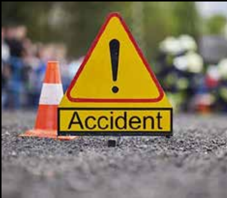
இந்தக் கோர விபத்தில் யுவதி சம்பவ இடத்திலேயே உயிரிழந்துள்ளார்.

தனியார் நிறுவனம் ஒன்றில் பணியாற்றும் மேற்படி யுவதி வேலை முடிந்து மோட்டார் சைக்கிளில் வீடு திரும்பிக் கொண்டிருந்தபோது வீதியில் எதிரே வந்த ஓட்டோ மோதியுள்ளது.