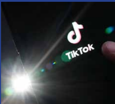
அமைச்சின் பேச்சாளர் மறுத்துள்ளார். விசாரணையின் முடிவில் கனடாவின்

இது தொடர்பில் விசாரணைகள் முன்னெடுக்கப்பட்டு வருகின்ற நிலையில், கனடாவின் முதலீட்டுச் சட்டத்தின் கீழ் இரகசியமாக இது முன்னெடுக்கப்படுவதால் மேலதிக தகவல்களை வழங்குவதற்கு தொழில்துறை