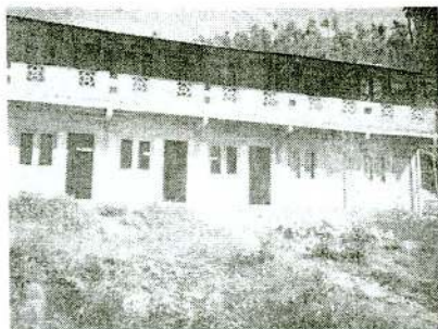
புதிய மாடி வீடுகள்

இத்திட்டத்தினைக் வீடமைப்பு நிர்மாணத்துறை அமைச்சர் ஆறுமுகன் இராமநாதன் தொண்டமான் தற்போது மலையகத்தின் ஹற்றன் பகுதியில் அறிமுகப்படுத்தியுள்ளார். மலையகத் தோட்டங்களில் காணப்படும் லயன் வீடுகள் உடைக்கப்பட்டு அவை மாடி லயன் வீடாகக்கட்டப்படுகின்றன. மேலும் இரு அறைகள் அதிகரிப்பது இதன் பிரதான நோக்கமாகும். அதாவது தற்போது இருக்கும் லயன்களுக்கு பதிலாக மாடி லயன்களை கட்டவதாகும். (இவ்வாறான மாடி வீடுகள் ஏலவே குறிப்பிடப் பட்டுள்ளது போல் வெள்ளையர் களினால் 1958 ஆம் ஆண்டுகளிலேயே ஹற்றன், பதுள்ள போன்ற பகுதிகளில் கட்டப்பட்டுள்ளமை குறிப்பிடத்தக்கது.)