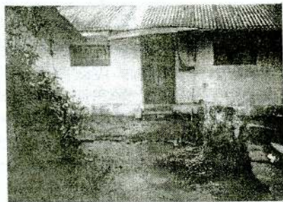
தற்போது பெரும்பான்மையாக காணப்படும் லயன் வீடுகள் 1924 ல் கட்டப்பட்டது