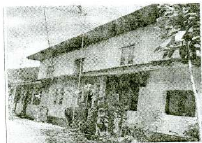
1958ல் நிர்மாணிக்கப்பட்ட மாடி வீடுகள்

சிறந்த வீடுகளை வழங்கும்படி பணித்தது. இதன் பின்னர் அன்றைய உரிமையாளர்கள் (வெள்ளையர்)தோட்ட தொழிலாளர்களுக்கு மாடி லயன்கள் உட்பட இரு வீடுகளை நிர்மாணிக்கும் முயற்சிகளை மேற் கொண்டனர். ஆயினும் இது இடையில் கைவிடப்பட்டது.