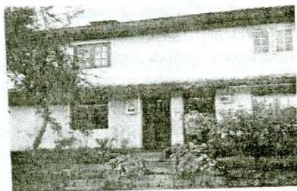
1954ல் நிர்மாணிக்கப்பட்ட மாடி வீடுகள்

1972-75 இல் தோட்டங்கள் தேசியமயமாக்கப்பட்டபின், 1978 ஆம் ஆண்டு முதல் ஆசிய அபிவிருத்தி வங்கியின் உதவியுடன் இரு இணை வீடு அமைப்பு திட்டங்களை அரசாங்கம் சில தோட்டங்களில் மேற்கொண்டது. 1978ஆம் ஆண்டுற்கும் 1980ஆம் ஆண்டிற்கும் இடையில் 3,749 இரு இணை வீடுகள் தொகுதியினை தோட்டத்துறையில் கட்டி முடித்தது. 1982 ஆம் ஆண்டு முதல் வருடம் 500 வீடுகளை கட்டி முடிக்கும் திட்டத்தினை அரசாங்கம் மேற் கொண்டது. இவ்வாறு கட்டப்பட்ட வீடுகள் அனைத்தும் தோட்ட முகாமைத்துவத்திற்கே சொந்தமாக்கப்பட்டன ஆனால் இக்காலக்கட்டத்தில் அரசினால் மேற்கொள்ளப்பட்ட ஏனைய வீடமைப்பு திட்டங்களை பொறுத்தமட்டில் அவ்வீடுகள், வீட்டினைப் பெறுபவர்களுக்கே சொந்தமாக்கப்பட்டது. தோட்டத் தொழிலாளர்களுக்கு வீடு சொந்தமாக்கப்பட வேண்டும் என்ற கோரிக்கை 1987 இலேயே வலுப்பெற ஆரம்பித்தது. 1986ஆம் ஆண்டு நாடாளுமன்றக்கு குடியரிமை வழங்கும் திருத்தச் சட்டம் கொண்டு வந்ததைத் தொடர்ந்து நாமும் இந்தநாட்டிற்குரியவர் என்ற உணர்வு மலையக மக்கள் மத்தியில் மேலும் வலுப் பெற்றதுடன், நாட்டின் ஏனையோருக்கும் கிடைக்கும் உரிமைகள் எமக்கும் கிடைக்க வேண்டும் என்ற எண்ணமும் வலுப்பெற்றது. இச்சூழலிலேயே 1987ஆம்ஆண்டு சர்வதேச குடியிருப்பு வருடமாக ஐ.நா.சபையினால் பிரகடனப்படுத்தப்பட்டது. இச்சந்தர்ப்பத்தில் மறைந்த அமைச்சர் செளமிய மூர்த்தி தொண்டமான் அவர்கள் தோட்ட குடியிருப்புக்களை தோட்டத் தொழிலாளர்களுக்கே சொந்தமாக்கும் படி கோரிக்கை விடுத்தார். அதேவேளை ஏனைய தொழிற் சங்கத்தலைவர்கள் வாழ்வதற்கு உகந்ததற்ற லயன் காம்பிராக்களை உடைத்தெறிந்து புதிய வீடுகளை அடிப்படை வசதிகளுடன் நிர்மாணித்து அதனை தோட்டத்