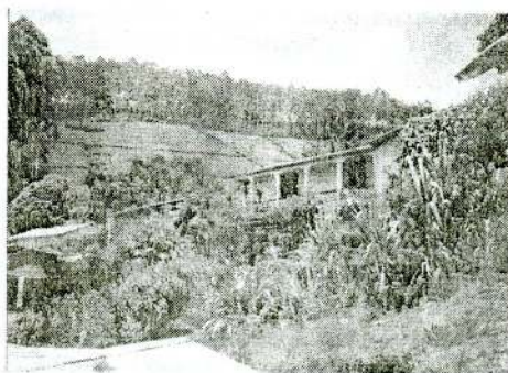
தோட்ட எல்லைகளில் 7 பேர்ச் காணியில் கட்டப்பட்ட வீடுகள்

இதற்கமைய இன்று மலையகத்தின் அனைத்து பாரிய தோட்டங்களிலும் தோட்ட வீடமைப்பு கூட்டறவுச் சங்கம் அமைக்கப்பட்டுள்ளது. புதிய வீடு கட்டுதல் அல்லது இருக்கும் லயன் காம்பிராக்களை விஸ்தரித்தலுக்கான முயற்சிகள் மேற் கொள்ளப்படின குறிப்பிட்ட தொழிலாளி கூட்டறவு சங்கத்தில் அங்கம் பெறுதல் வேண்டும். தொழிலாளி தனது பணத்தைக் கொண்டு வீட்டைக் கட்டிய போதும் ஈற்றில் வீடு கூட்டறவு சங்கத்திற்கும் சொந்தமாக இருக்கம். இது தொடர்பாக திறைசேரியின் பிரதிச் செயலாளர் 1993 ஏப்பிரல் 12 ஆம் திகதியன்று உணவு மற்றும் கூட்டறவு அமைச்சின் செயலாளருக்கும் அனுப்பிய கடிதத்தில், தோட்ட வீடுகளின் உரித்துடைமைப்பற்றி குறிப்பிடுகையில்.