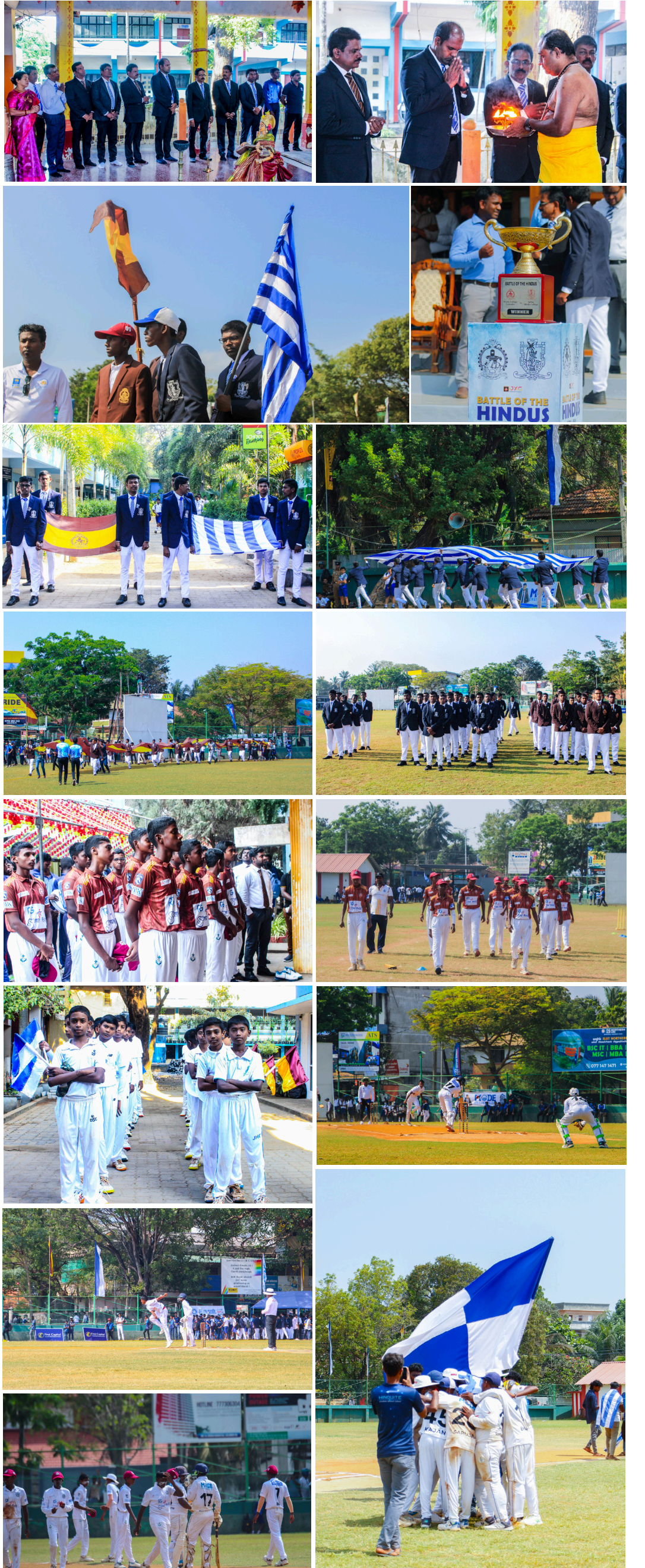
இந்துக்களின் போர் என்று வர்ணிக்கப்படும் யாழ்ப்பாணம் இந்துக் கல்லூரி - கொழும்பு இந்துக் கல்லூரி அணிகளின் பெருந்துடுப்பாட்ட போட்டி நேற்று ஆரம்பமாகி நடைபெற்ற வேளை...!