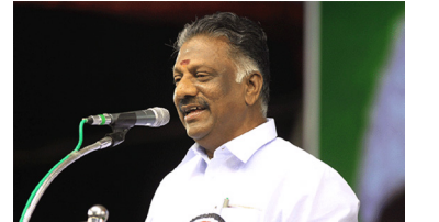
சென்னை, மார்ச் 16

“மக்களவைத் தேர்தல் நிலைப்பாடு குறித்து வரும் தகவல்கள் உண்மைக்குப் புறம்பானவை” என்று தேர்தலை புறக்கணிக்க போவதாக எழுந்த செய்தி குறித்து முன்னாள் முதல்வர் ஓ. பன்னீர்செல்வம் தெரிவித்துள்ளார்.