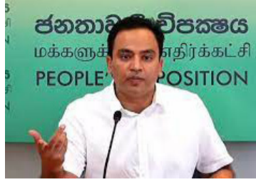
கூட்டணியில் இடமில்லை. இந்நாட்டில் உருவான மிகப் பெரிய கூட்டணியாக எமது கூட்டணி அமையும்.” - என்றார். (ஐ)

அனைத்து கட்சிகளில் இருந்தும் வருகின்றனர். சிவில் அமைப்பு களும் இணைந்துள்ளன. மேலும் பல தரப்பினரும் பேச்சு நடத்தி வருகின்றனர். ஊழல்வாதிகள், மோசடிக்காரர்கள், இனவாதிகள் மற்றும் மதவாதிகளுக்கு