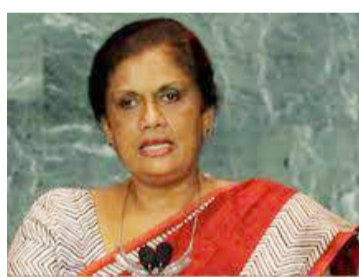
டது. அரசியல் தொடர்பில் கருத்து வெளியிட ஏதுவும் இல்லை - என்று அவர் கூறியுள்ளார். (ஐ)

நாட்டின் அரசியலின் தற்போதைய நிலையை நான் வெறுக்கிறேன் - அரசியல் வெறுத்துவிட்டது. அரசியல் தொடர்பில் கருத்து வெளியிட ஏதுவும் இல்லை - என்று அவர் கூறியுள்ளார். (ஐ)