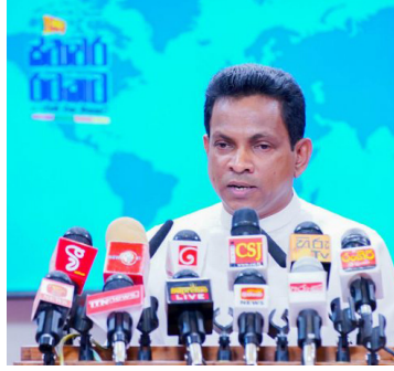
டம் ஒப்படைக்க தயாராக உள்ளோம். இதன்படி 162 பாலங்களும் எதிர்வரும் ஓகஸ்ட் மாதத்திற்கு முன்னர் மக்களிடம் கையளிக்கப்படும்-என்றார்.

அந்தப் பாலங்களில் ஒரு பகுதியை ஏப்ரல் 10 ஆம் திகதிக்கு முன்னதாக பொதுமக்கள்