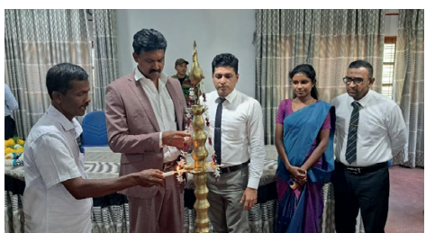
கொண்டுள்ளதுடன், 100 பேருக்குக் காணி உரிமை பத்திரம் வழங்கப்பட்டுள்ளது.