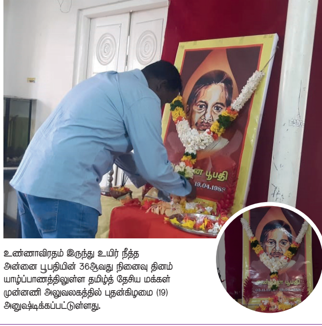
உண்ணாவிரதம் இருந்து உயிர் நீத்த அண்ணா பூதியின் 36ஆவது நினைவு தினம் யாழ்ப்பாணத்திலுள்ள தமிழ்த் தேசிய மக்கள் முன்னணி அலுவலகத்தில் புன்கிழமை (19) அனுஷ்டிக்கப்பட்டுள்ளது.