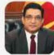
Hon. Ali Sabry Minister of Foreign Affairs

Seafarers are the lifeblood of global trade, transporting goods and fostering international commerce. While fisheries contribute heavily to maritime activities, seafaring encompasses a broader spectrum. The dedication of seafarers significantly impacts the global trade of fishery products, and I, as the Minister of Fisheries, deeply appreciate their invaluable role. I commend the vision of the Minister of Ports, Shipping, and Aviation Hon. Nimal Siripala De Silva (M.P.), Attorney-at-Law and Solicitor of the United Kingdom, guided by the leadership of His Excellency the President Ranil Wickremesinghe, in nurturing high-caliber seafaring professionals. Their unwavering efforts through National Seafarers' Day celebrations to enhance employment opportunities are truly commendable.