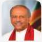
Hon. Dinesh Gunawardena Prime Minister Democratic Socialist Republic of Sri Lanka

I extend my heartfelt congratulations to the Ministry of Ports, Shipping, and Aviation for their proactive measures aimed at bolstering the seafaring community. I wish all stakeholders involved in this important event every success in their endeavours.