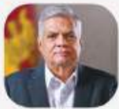
Hon. Ranil Wickremesinghe President Democratic Socialist Republic of Sri Lanka

It is indeed a pleasure to acknowledge the commendable efforts undertaken by the Ministry of Ports, Shipping and Aviation in nurturing a skilled cadre of professional seafarers, as outlined in their corporate vision.