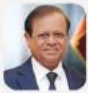
Hon. Susil Premajayantha Minister of Education

The Ministry of Ports, Shipping, and Aviation is committed to increase the number of seafarers in Sri Lanka to 50,000 by 2030. However, it has been observed that the lack of awareness about seafaring industry and its reality by the public has been a serious shortcoming. When the society is unaware of evolving lucrative jobs in the shipping sector particularly in seafaring, parents and teachers cannot guide the younger generation in the right direction. Social awareness plays a significant role in overcoming the various challenges towards these capacity building initiatives in this sector. We have also identified the relevance of incorporating this indispensable subject in the school curriculum. Therefore, the launch of the textbook in shipping education written in our national language sets another important milestone. This textbook could be the foundation to incorporate this incredibly important subject in school curriculum thus the sustainable capacity building initiatives. The ministry is pleased about the initiatives and collaboration by CINEC Campus in making this event a reality.