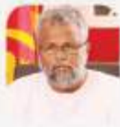
Hon. Douglas Devananda Minister of Fisheries

As the Minister of Education, I feel honoured to send a congratulatory message to the Ministry of Ports, Shipping and Aviation on the inaugural national seafarers' day celebration. We believe that investing in maritime education and training is essential for developing a skilled workforce and meeting the growing demand for seafaring jobs. By equipping individuals with the necessary knowledge, skills, and qualifications, education contributes to the sustainability and growth of the maritime sector while enhancing job opportunities for aspiring seafarers. Therefore, establishing a national day for seafarers is timely because it may pave the way for future generations to get the awareness of the maritime industry and great potential exists for seafarers.