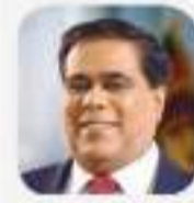
Hon. Nimal Siripala de Silva, M.P. Minister of Ports, Shipping and Aviation

I wish the celebration of the National Seafarers' Day every success.