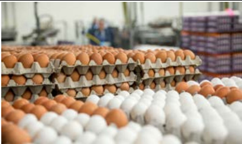
எதிர்வரும் பண்டிகைக் காலத்தை முன்னிட்டு இந்தியாவிலிருந்து 42 மில்லியன் முட்டைகளை இறக்குமதி செய்ய அமைச்சரவை அனுமதி வழங்கப்பட்டுள்ளது.

முன்னதாக நடந்த அமைச்சரவை கூட்டத்தில், ஏப்ரல் 30 ஆம் திகதி வரை முட்டை இறக்குமதி செய்ய முடிவு செய்யப்பட்டிருந்தது. அதற்கமைய இதுவரை 18 மில்லியன் முட்டைகள் இறக்குமதி செய்யப்பட்டுள்ள போதிலும், பண்டிகைக் காலத்திற்காக அதிகளவு முட்டை இறப்புகள் தேவைப்படுவதாக இனங்காணப்பட்டுள்ளது.