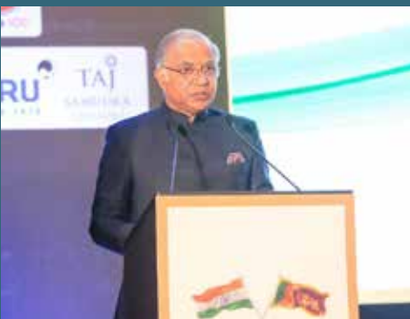
2000 ஆம் ஆண்டு கைச்சாத்திடப்பட்ட சுதந்திர வர்த்தக உடன்படிக்கை

கொழும்பில் இடம்பெற்ற நிகழ்வொன்றில் கலந்துகொண்டு கருத்துரைத்த போதே அவர் இதனைக் குறிப்பிட்டுள்ளார்.