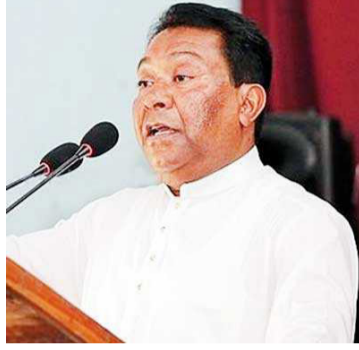
தீர்மானித்தால் அதற்கான பெரும்பான்மை ஜனாதிபதிக்கு காண்பிக்கப்படும்-என்றார். (அ)

ஜனாதிபதி தேர்தலுக்கு முன்னர் பொதுத்தேர்தல் நடத்தப்பட வேண்டும் என கட்சி