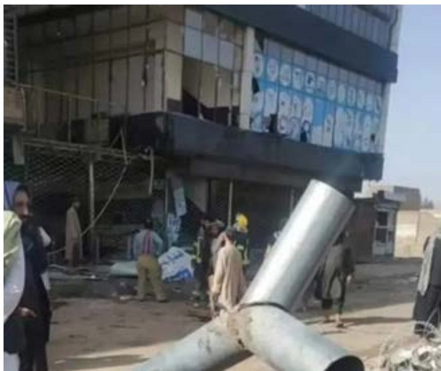
ஆப்கானிஸ்தானில் நேற்று வியாழக்கிழமை நடத்தப்பட்ட தற்கொலைத் தாக்குதலில் 21 பேர்

மறைத்துவைத்திருந்த வெடிகுண்டை வெடிக்கச் செய்துள்ளார். இதில் 21 பேர் உயிரிழந்ததாக