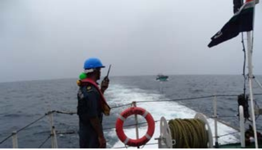
நடுக்கடலில் இந்திய மீனவர்களுக்கும் பாகிஸ்தான் கடலோரக் காவல் படையினருக்கும் ஏற்பட்ட மோதலில் 2 இந்திய மீனவர்கள் காணாமல் போனதாகவும்,

கடுமையான எச்சரிக்கைக்குப் பிறகு அந்தப் படகு அந்தப் படகைப் பரிசோதனை செய்ய கடலோர காவல்