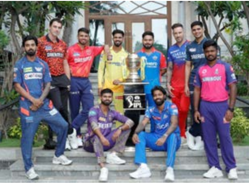
17ஆவது ஐபிஎல் தொடர் இன்று சென்னையில் ஆரம்பமாகின்றது. சென்னை சேப்பாக்கம்

தலைவராக இருந்த மகேந்திரசிங் டோனி, புதனையே ருதுராஜிட் கையளித்துள்ளதாக அந்த அறிவிப்பில் தெரிவிக்கப்பட்டிருந்தது.