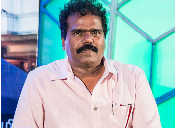
இதிலேயே தங்கர் பச்சானின் பெயரும் இடம்பெற்றுள்ளது. தமிழில் வெளியான 'அழகி',

சென்னை, மார்ச் 23 கடலூர் மக்களவைத் தொகுதியில் இயக்குநர் தங்கர் பச்சான் போட்டியிடுவார் என பாட்டாளி மக்கள் கட்சி அறிவித்துள்ளது. இதனை அவரும் உறுதி செய்துள்ளார். பா. ஜ. கட்சியில் இடம் பெற்றுள்ள பா. ம. க. தனது 10 தொகுதிகளில் 9 தொகுதிகளில் போட்டியிடவுள்ள வேட்பாளர்களை அறிவித்தது.