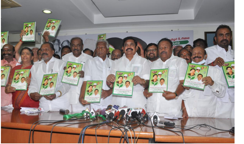
சென்னையில் உச்சநீதிமன்றக் கிளையை நிறுவவேண்டும், தமிழை வழக்காடு மொழியாக பிரகடனம் செய்ய வேண்டும் என்பவற்றை வலியுறுத்தியுள்ளது. (ஐ)

சென்னை, மார்ச் 23 குடியுரிமை திருத்தச் சட்டத்தில் இலங்கைத் தமிழர்கள், இஸ்லாமியர்கள் உள்வாங்கப்பட வேண்டும் என்று அ. தி. மு. க. கட்சி தனது தேர்தல் விஞ்ஞாபனத்தில் தெரிவித்துள்ளது. அத்துடன், இலங்கைக்கு வழங்கப்பட்ட கச்சதீவையும் மீட்க வேண்டும் என்றும் அதில் கூறியுள்ளது. பாராளுமன்றத் தேர்தலில் எதிர்வரும் 19ஆம் திகதி தமிழ்நாட்டில் வாக்குப் பதிவு நடைபெறவுள்ளது. இந்த நிலையில், அ. தி. மு. க. கட்சியின் பொதுச் செயலாளர் எடப்பாடி பழனிசாமி நேற்று தமது கட்சியின் தேர்தல் அறிக்கையை வெளியிட்டார். 133 வாக்குறுதிகளை முன்வைத்துள்ள அ. தி. மு. க. கட்சி,