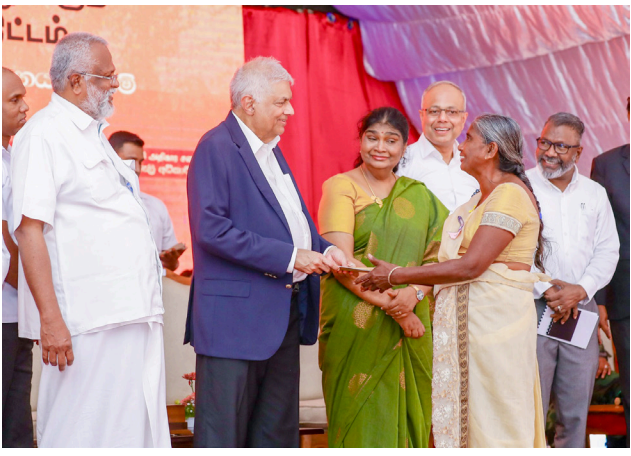
கள மக்கள் குடியேற்றப்பட்டு வருகின்றனர். வடக்கு, கிழக்கு மாகாணங்களை இணைக்கும் பகுதியாக மணலாறு உள்ளது. இந்த இரு மாகாணங்களின் நிலத்தொடர்பையும்

யாழ்ப்பாணம், மார்ச் 23 தமிழரின் இதயபூமி என்று வர்ணிக்கப்படும் மணலாறில் (வெலிஓயா) சிங்கள சமூகத்தவருக்கு வலி.வடக்கில் - ஓட்டகப்புலத்தில் - வைத்து காணி களை வழங்கி வைத்தார் ஜனாதிபதி ரணில் விக்கிரமசிங்க. நேற்று வெள்ளிக் கிழமை யாழ்ப்பாணம் வந்த ஜனாதிபதி ரணில் விக்கிரமசிங்க 20 இலட்சம் பேருக்கு காணி உரிமை வழங்கும் "உறுமய" வேலைத் திட்டத்தின்கீழ் 408 பேருக்கு காணி உறுதிப் பத்திரங்களை வழங்கி வைத்தார். இவ்வாறு காணி உறுதி வழங்கப்பட்டவர்களில் அநேகமானவர்கள் பெரும்பான்மை இனத்தவர்களே என்று ஈழநாடு அறிந்து கொண்டது. மணலாறு பிரதேசம் ஏற்கனவே வெலி ஓயா எனப் பெயர் மாற்றப்பட்டு 1980கள் முதல் சிங்கள மக்கள் குடியேற்றப்பட்டு வருகின்றனர். வடக்கு, கிழக்கு மாகாணங்களை இணைக்கும் பகுதியாக மணலாறு உள்ளது. இந்த இரு மாகாணங்களின் நிலத்தொடர்பையும்