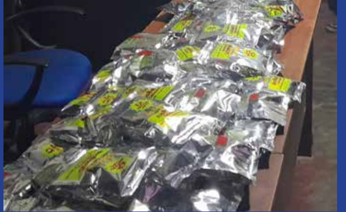
இது தொடர்பாக மேலதிக விசாரணைகளை சாவகச்சேரிப் பொலிஸார் முன்னெடுத்து வருகின்றனர்.

இதன்போது தென்னிலங்கையைச் சேர்ந்த சந்தேக நபர் ஒருவர் கைது செய்யப்பட்டிருக்கின்றார். கடத்தலுக்கு பயன்படுத்தப்பட்ட மகேந்திர ரக வாகனமும் அதிலிருந்த 72 லேகிய பைக்கெற்றுக்களும் பொலிஸாரால் கைப்பற்றப்பட்டுள்ளன.