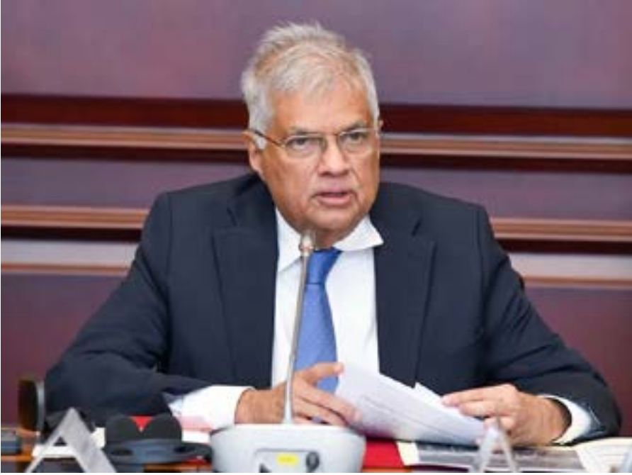
தற்போது நாட்டில் நவீன கல்வி முறையை

உருவாக்குவதற்கு நாங்கள் முயற்சி செய்து வருகிறோம். 2024 ஆம் ஆண்டுக்கு மாத்திரமன்றி 2030 ஆம் ஆண்டுக்கும் உகந்த கல்வி முறையை உருவாக்க வேண்டும். அந்தப் பணிகளை இப்போது செய்து வருகிறோம். ஆசிரியர்களுக்கு பயிற்சி அளித்தல், நவீன தொழிநுட்ப அறிவை வழங்குதல் போன்ற திட்டங்கள் செயல்படுத்தப்பட்டுள்ளன. என்று ஜனாதிபதி ரணில் விக்ரமசிங்க தெரிவித்துள்ளார். நாரஹேன்பிட்டி சுஜாதா மகளிர் கல்லூரியில் நேற்று (25) இடம்பெற்ற “2024 பாடசாலை உணவுத் திட்டம்” ஆரம்ப நிகழ்வில் கலந்து கொண்ட ஜனாதிபதி ரணில்