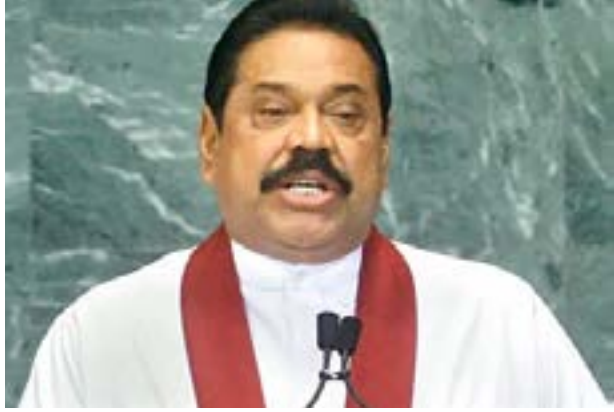
அடைய முடியவில்லை எனவும், அரசாங்கத்தின் மீது மக்கள் குற்றம் சாட்டுகின்றனர் எனவும் தெரிவித்துள்ளார். (ரெம-91)

இம்முறை மே தின கொண்டாட்டத்தை பிரமாண்டமாக கொண்டாட கட்சி திட்டமிட்டுள்ளது எனக் கூறிய முன்னாள் ஜனாதிபதி, அரசாங்கத்தின் தற்போதைய செயற்பாடுகள் குறித்து தன்னால் திருப்தி