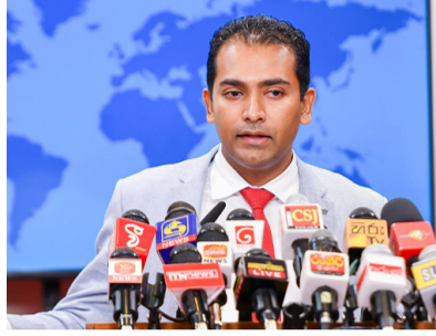
பெரமுன கட்சியின் மே தினக் கூட்டம் கொழும்பு, கெம்பல் பார்க் மைதானத்தில் நடைபெறும் என்று கூறினார். (அ)

மே தினக் கூட்டத்துக்கான ஏற்பாடுகள் பற்றியே இன்றைய கூட்டத்தில் ஆராயப்பட்டது எனவும் இராஜாங்க அமைச்சர் கூறினார். அதேவேளை, இதன்போது கருத்து வெளியிட்ட பாராளுமன்ற உறுப்பினர் மஹிந்தா னந்த அளுக்கமகே, பொதுஜன