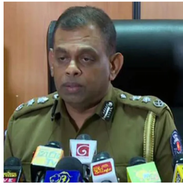
தவிர்க்கக்கூடும். எனவே, சட்டங்களை கடைப்பிடித்து சுற்றுலாப் பயணிகளுக்கு அமைதியான சூழலை ஏற்படுத்தி கொடுப்பது மிகவும் அவசியமாகும்-என்றார். (அ)

எனவே, சட்டங்களை கடைப்பிடித்து சுற்றுலாப் பயணிகளுக்கு அமைதியான சூழலை ஏற்படுத்தி கொடுப்பது மிகவும் அவசியமாகும்-என்றார். (அ)