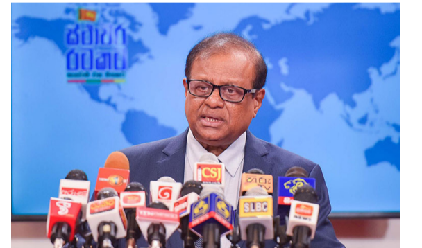
ஒதுக்குவதற்கு அரசாங்கம் எதிர்பார்த்துள்ளதாகவும் கல்வி அமைச்சர் சசில் பிரேமஜயந்த தெரிவித்துள்ளார். (ஐ)

இதற்காக மாணவி ஒருவருக்கு தலா 1,200 ரூபாய் பெறுமதியான வவுச்சர் வழங்கப்படும் எனவும், இந்த திட்டத்துக்காக 100 கோடி ரூபாயை