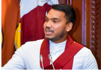
பதாகவும் அந்த வேட்பாளர் யார் என்பதை கட்சி இன்னும் தீர்மானிக்கவில்லை எனவும் அவர் தெரிவித்தார். (அ)

பல ஜனாதிபதி வேட்பாளர்களைக் கொண்டுள்ளதாகவும் நாமல் குறிப்பிட்டார். இதன்படி எதிர்வரும் ஜனாதிபதித் தேர்தலில் வெற்றி பெறும் பொது வேட்பாளரை முன்வைக்க தாம் தயாராக இருப்ப