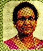
விமல் பரம் பக்கம் 19