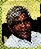
பேராசிரியர் மொளனகுரு பக்கம் 18