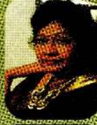
தீபதிலகை பக்கம் 26