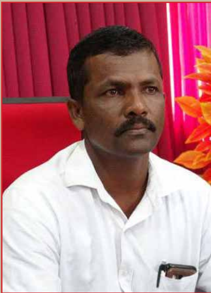
( வி.ரி.சகாதேவராஜா )

திட்டமிட்ட புறக்கணிப்பு என்று நாடாளுமன்றில் முழுங்கிய கலையரசன் எம்.பி.