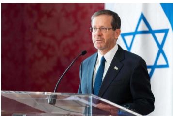
நிறுவனத்தின் தலைவர் ஜோஸ் அன்ரெஸுடன் தான் உரையாடியதாக இஸ்ரேலிய ஜனாதிபதி ஐசக் ஹேர்லோக் தெரிவித்துள்ளார்.

இதேவேளை, இத்தாக்குதல் தொடர்பான தனது ஆழ்ந்த கவலையை தெரிவிப்பதற்கும் மன்னிப்பு கோருவதற்காகவும் வேர்ல்ட் சென்ட்ரல் கிச்சன்