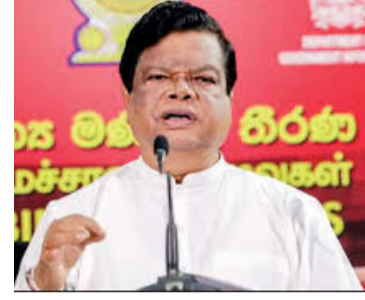
நீடிக்கப்பட்ட கடன் வசதியை பெறுவதற்கான இணக்கப்பாடு எட்டப்பட்டது.

இங்கு மேலும் கருத்து தெரிவித்த அமைச்சர், “கடந்த காலத்தில் வீழ்ச்சியடைந்த நாட்டை மீளக் கட்டியெழுப்பும் சவாலான பணியை ஜனாதிபதி ரணில் விக்கிரமசிங்க ஏற்றுக்கொண்டதன் பின்னர், சர்வதேச நாணய நிதியத்தின்