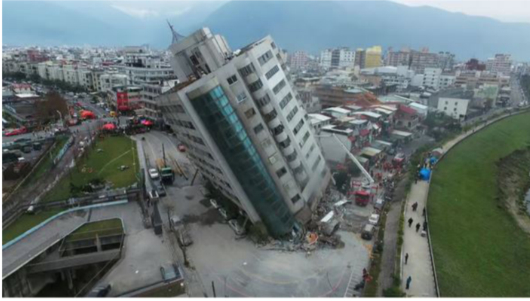
கடுமையான சேதமேற்பட்டுள்ளதாகவும் அந்நாட்டு ஊடகங்கள் செய்தி வெளியிட்டுள்ளன. சேதத்திற்குள்ளான கட்டிடங்களில் வசித்த பொதுமக்களை தற்போது மீட்கும் பணிகள்

பாரிய நிலநடுக்கம் காரணமாக பல கட்டடங்கள் இடிந்து