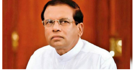
முறைப்பாட்டுக்கு அமைய இந்த உத்தரவு பிறப்பிக்கப்பட்டுள்ளது.

கொழும்பு, ஏப். 05 முன்னாள் ஜனாதிபதி மைத்திரிபால சிறிசேன, சிறீ லங்கா சுதந்திரக் கட்சியின் தவிசாளராக பதவி வகிப்பதை தடுத்து கொழும்பு மாவட்ட நீதிமன்றம் நேற்று இடைக்கால தடை பிறப்பித்துள்ளது. ஏப்ரல் 18 ஆம் திகதி வரை அமுலாகும் வகையில் இந்த இடைக்கால தடையுத்தரவு பிறப்பிக்கப்பட்டுள்ளது. முன்னாள் ஜனாதிபதி சந்திரிகா பண்டாரநாயக்க குமாரதுங்க செய்த