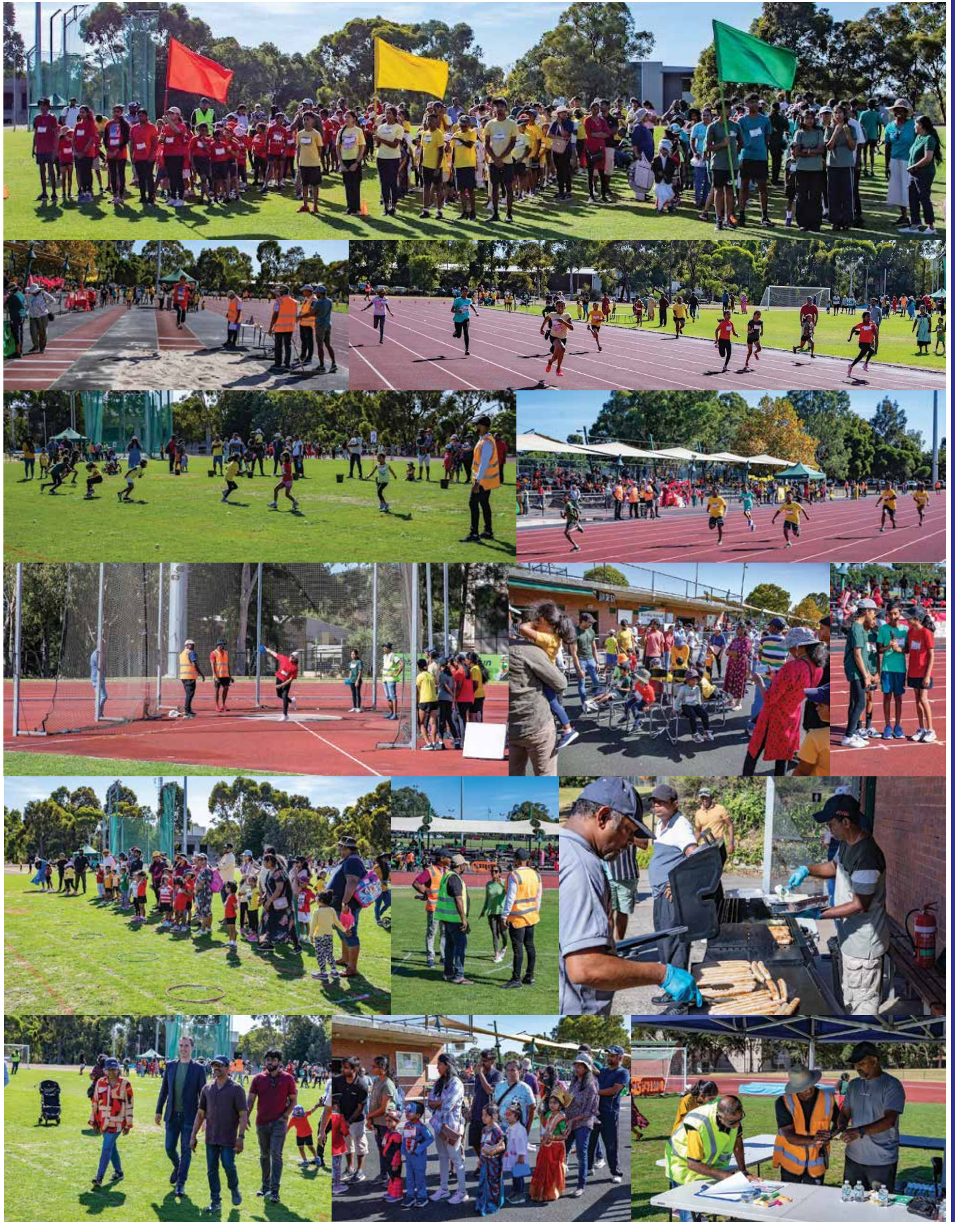
பாரதி பள்ளியின் வருடாந்த விளையாட்டுப் போட்டி மார்ச் 17ம் திகதி, மெல்பரின் சிறப்புமிக்க விளையாட்டரங்கான Bill Stewart Athletics Trackஇல் முழு நாள் நிகழ்வாக இடம்பெற்றது. கம்பர், வள்ளுவர், இளங்கோ ஆகிய மூன்று இல்லங்களுக்கிடையே நடந்த பலத்த போட்டியில், இளங்கோ இல்லம் 218 புள்ளிகளைப் பெற்று வெற்றியீட்டியது. வள்ளுவர், கம்பர் இல்லங்கள் முறையே 193, 124 புள்ளிகளைப் பெற்றன. பாரதி பள்ளியின் முப்பதாண்டு நிறைவை ஒட்டி நடந்த விளையாட்டுப் போட்டி என்பதால், பிள்ளைகளும் வளர்ந்தோருமாக ஆயிரம் பேர் அளவில் பங்குபற்றியிருந்தனர்.