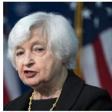
தமது பயணத்தில், சீனாவின் மின்வாகனங்கள், மின்கலன்கள், சூரியசக்தித் தகடுகள் உள்ளிட்ட பசுமை எரிசக்திப் பொருள்கள் ஆகியவற்றின் ஏற்றுமதி வெகுவாக அதிகரிப்பது குறித்து அவர் கவலை தெரிவித்தார். சீன அரசாங்கத்தின் ஆதரவால் அந்நாட்டில் உற்பத்தி

பெய்ஜிங்கின் தொழிற்சாலை உற்பத்தியைக் கட்டுக்குள் வைத்திருக்கும்படி வலியுறுத்தும் நோக்கில் அவர், சீனப் பிரதமர், நிதி அமைச்சர், மத்திய வங்கி ஆளுநர் போன்ற பலரையும் சந்தித்துப் பேசினார்.