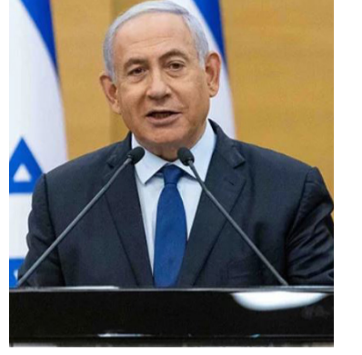
அம்மக்களை பாதுகாப்பான இடத்திற்கு வெளியேற்ற அமெரிக்கா வலியுறுத்தி வருவதாகவும் தெரிவிக்கப்படுகின்றது. காசா மீது இஸ்ரேல் இராணுவம் நடத்திய தாக்குதலில் இதுவரை 33,200 பேர் கொல்லப்பட்டுள்ளதோடு 76 ஆயிரத்திற்கும் மேற்பட்டோர் காயம் அடைந்துள்ளனர் என்பதும் குறிப்பிடத்தக்கது. (அ)

எனினும் ரஃபாவில் 1.4 மில்லியன் பாலஸ்தீன மக்கள் இருப்பதால் ரஃபாமீது தாக்குதல் நடத்த அமெரிக்கா வருப்பம் தெரிவிக்கவில்லை எனவும்,