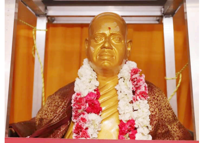
சுவாமி விபுலானந்த அடிகளார் SUVAMI VIPULANANTHA ADIKALAR

அன்றிலிருந்து தொடங்கிய ஒரு இலட்சிய கனவுதான் இப்போது நனவாகி இருந்தது. இங்கே கிட்டத்தட்ட