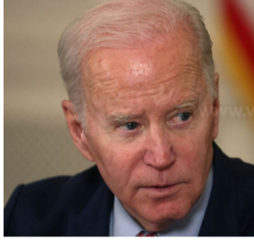
யும் அனுமதிக்கவேண்டும் என நான் வேண்டுகோள் விடுக்கின்றேன் என பைடன் குறிப்பிட்டார். (அ)

நெடுஞ்சாலையில் மனிதாபிமான அமைப்புகளின் வாகனங்கள் தாக்கப்பட்டமை மூர்க்கத்தனமான விடயம் என பைடன் தெரிவித்தார். இஸ்ரேலியர்கள் யுத்த நிறுத்தத்தை அறிவிக்கவேண்டும் அடுத்த ஆறுமாதம் எட்டு மாதங்களிற்கு அனைத்து விதமான மனிதாபிமான பொருட்களை