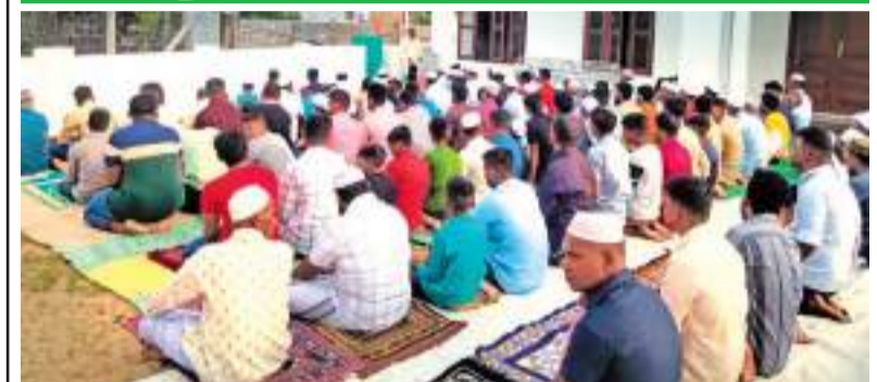
பாலமுனை ஹைமா பள்ளிவாசல் முன்றலில் இடம்பெற்ற நோன்புப் பெருநாள் தொழுகையின் போது.