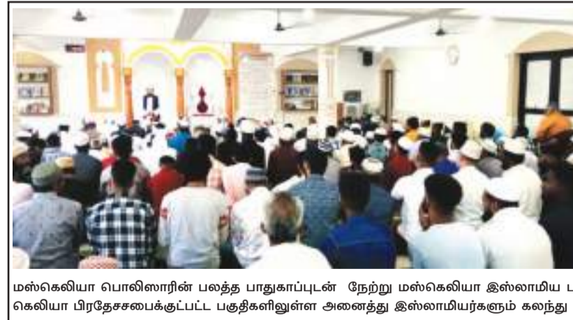
மஸ்கெலியா பொலிஸாரின் பலத்த பாதுகாப்புடன் நேற்று மஸ்கெலியா இஸ்லாமிய பள்ளிவாசலில் நோன்பு பெருநாள் தொழுகை நிகழ்வுகள் நடைபெற்றன. இந்நிகழ்வில் மஸ்கெலியா பிரதேசஸபைக்குட்பட்ட பகுதிகளிலுள்ள அனைத்து இஸ்லாமியர்களும் கலந்து கொண்டனர்.

தோட்ட குடியிருப்பில் 6 லயன்கள் காணப்பட்டதோடு அதில் ஒரு வீட்டில் இச் சம்பவம் பதிவாகியிருந்தது.