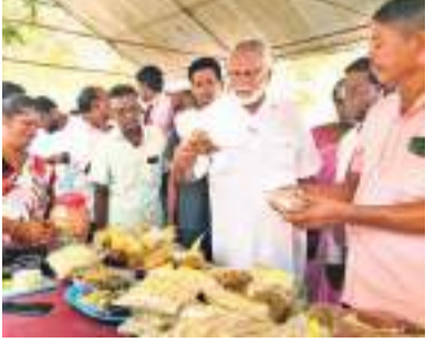
வில் உரையாற்றும்போதே அமைச்சர் மேற்கண்டவாறு தெரிவித்தார்.

நெடுந்தீவு பிரதேச மக்களுக்கான அடிப்படை தேவைகளை நிறைவேற்றும் வகையில் ஜனாதிபதியுடன் கலந்துரையாடி விசேட நிதியைப் பெற்றுக் கொள்ள முயற்சிப்பதாக அமைச்சர் டக்ளஸ் தேவானந்தா தெரிவித்தார். வெளிநாட்டு நிதியுதவியில் ஆரம்பிக்கப்பட்டுள்ள காற்றாலை மின் உற்பத்தி திட்டம் முர்த்தியானதும் மின் கட்டணத்தை குறைப்பதற்கு நடவடிக்கை மேற்கொள்ளப்படும் எனவும் தெரிவித்தார். நெடுந்தீவு பிரதேசத்தில் நேற்று (10) நடைபெற்ற சமுர்த்தி அபிமானி வர்த்தக சந்தையை ஆரம்பிக்கும் நிகழ்வு