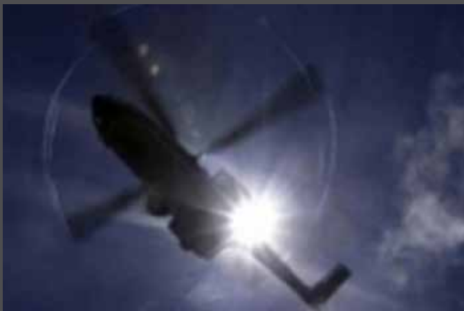
இதனையடுத்து இராணுவப் பயிற்சிகள் தற்காலிகமாக நிறுத்தப்பட்டன.

இதனால் நிலைதடுமாறி கேவிட் சிட்டியில் உள்ள ஒரு சந்தைப்பகுதி அருகே ஹெலிக்கொப்டர் விழுந்து நொறுங்கியது. ஹெலிக்கொப்டர் கீழே விழுவதை பார்த்த பொதுமக்கள் பதறியடித்துக்கொண்டு ஓட்டம் பிடித்தனர். இந்த விபத்தில் 2 இராணுவ வீரர்கள் உடல் சிதறி பலியாகினர்.