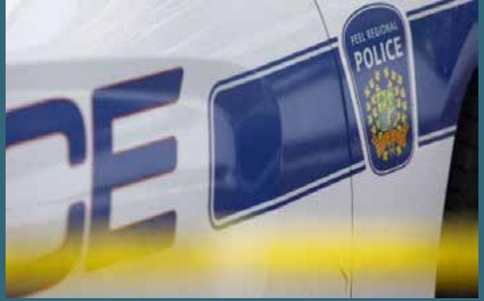
இந்த சம்பவத்துடன் தொடர்புடைய குற்றச்சாட்டின் பேரில் இரண்டு பேரை களையப் பொலிஸார் கைது செய்துள்ளனர்.

விசாரணைகளின் போது களவாடப்பட்ட 22 வாகனங்கள் மீட்கப்பட்டுள்ளன எனவும் இவற்றின் பெறுமதி 1.6 மில்லியன் டொலர்கள் எனவும் தெரிவிக்கப்படுகின்றது.