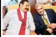
ஜனாதிபதி ரணில் விக் கிரமசிங்கவுக்கும், ஸ்ரீலங்கா பொது ஜன பெரமுன 06▶

முழுக்கம்: 01 | வள்ளுவர் ஆண்டு 2055 | சித்திரை 03 | செவ்வாய்க்கிழமை | 16.04.2024 | அதிர்வு 259