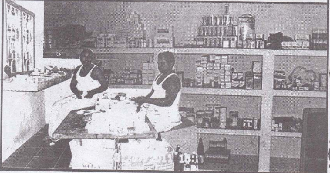
ஊழ் நல்லவருக்கு வழி காட்டுகிறது.