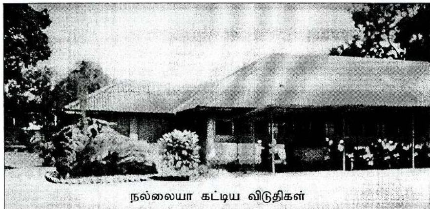
நல்லையா கட்டிய விடுதிகள்

கத்தோலிக்க கன்னியாஸ்திரீகளின் மருத்துவ சேவை :