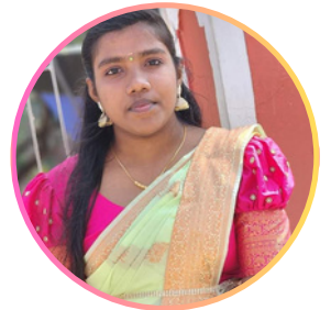
செல்வி நிரோயினி ஞானோதயம்

சமூகமே உன் எண்ணத்தை தெளிவுபடுத்தி என் நன்மையை நினைத்திடு வன்முறையை உடைத்து எறிந்து சமூகத்திலே முன்னேறிடு .