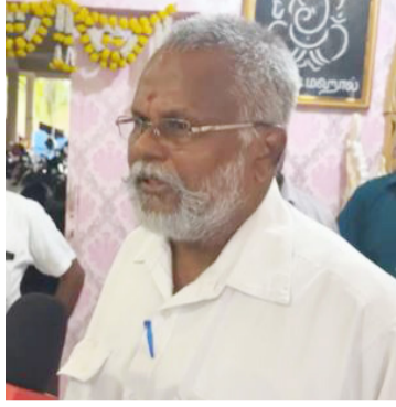
முறைச் சாத்தியமானதாக இருக்கும்.

அதேபோன்று எதிர்காலத்திலும் எமது பிரச்சனைகளை தீர்ப்பதற்கும் ஒரு தேசிய நல்லிணக்கப் பொறிமுறையே நடை