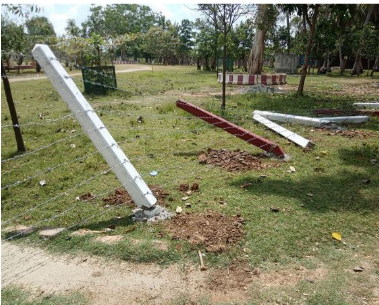
அவர்கள் கூறுகிறார்கள். இத்தனை வருடம் இல்லாத வேலி

சாதிப் பாகுபாடு காரணமாக இந்த வேலி அமைக்கப்பட்டதாக ஒரு பகுதியினர் குற்றம்சாட்டி, ஆலய நிர்வாகம் அதை மறுத்துள்ளது. பிரச்சனையை திசைதிருப்ப சாதிய குற்றச் சாட்டு சுமத்தப்படுவதாக