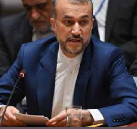
இஸ்ரேலின் தாக்குதலுக்கு பதிலடி கொடுக்கப்போவதில்லை என ஈரான் அறிவித்துள்ளது.

இதேவேளை, கடந்த முதலாம் திகதி சிரியாவில் உள்ள தனது தூதரகம் மீது இஸ்ரேல் நடத்திய வான்வழி தாக்குதலில் 13 பேர் கொல்லப்பட்டதற்கு கொடுக்கும் வகையில் ஈரான் சமீபத்தில் இஸ்ரேல் மீது 300 இற்கும் மேற்பட்ட தாக்குதல்களை மேற்கொண்டிருந்தது.