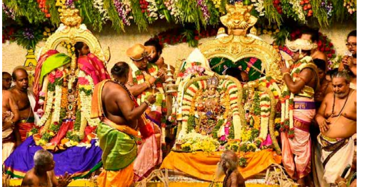
உலக பிரசித்தி பெற்ற மதுரை மீனாட்சி அம்மன் கோயிலில் மீனாட்சி - சுந்தரேசுவரர் திருக்கல்யாணம் நேற்று நடைபெற்றபோது...