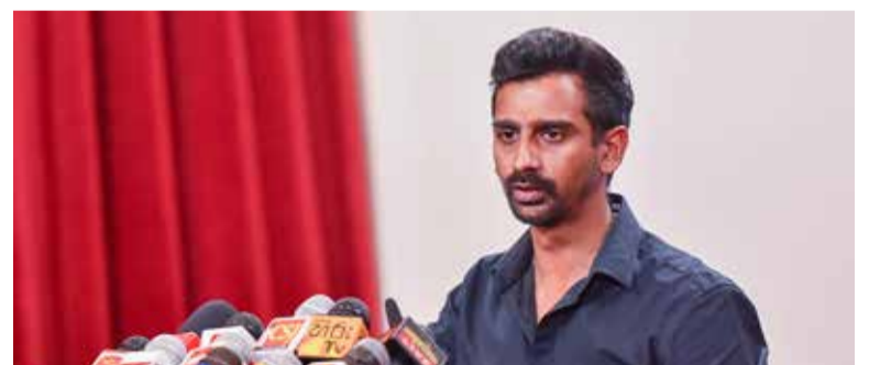
தார் என்று அமைச்சர் கூறியுள்ளார்.

கொழும்பு, ஏப். 22 ஐஸ் போதைப் பொருளை வைத்திருந்த குற்றச்சாட்டில் கைது செய்யப்பட்ட இரண்டு இலங்கை கடற்படை அதிகாரிகள் உள்ளிட்ட நால்வரை விளக்க மறியலில் வைக்க புதுக்கடை