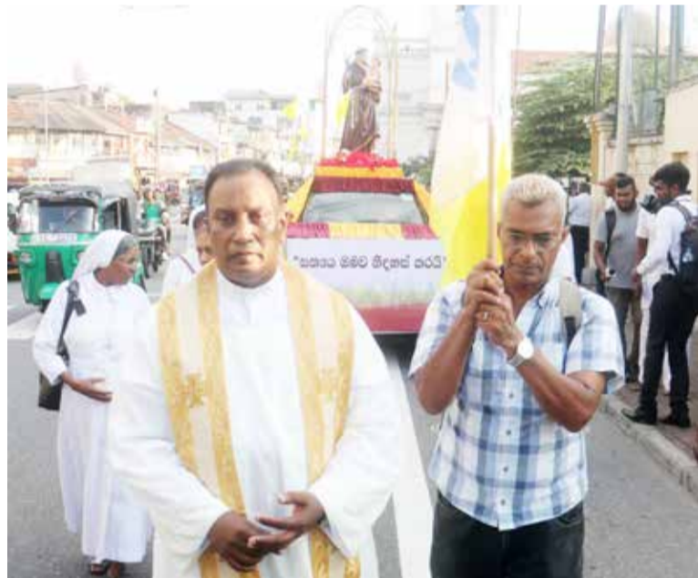
2019 ஏப்ரல் 21 (உயிர்த்த ஞாயிறு) தாக்குதலில் கொல்லப்பட்டவர்களின் 5ஆவது ஆண்டு நினைவுதினத்தையொட்டி நேற்றுமுன்தினம் கொச்சிக்கடை அந்தோனியார் ஆலயத்திலிருந்து நீர்கொழும்பு - கட்டுவாப்பிட்டி புனித செபஸ்தியார் தேவாலயம் வரை நடத்தப்பட்ட ஊர்வலத்தின்போது...

இதேநேரம், சந்திரிகா தலைமையில் சட்டவிரோதமாக கூடிய தரப்பினரும் தமது சட்டவிரோதமான தெரிவுகளை தேர்தல்கள் திணைக்களத்துக்கு அனுப்பி வைத்துள்ளனர். தேர்தல்கள் திணைக்களம் எதிர்வரும் 29ஆம் திகதி உரிய பதிலை வழங்கவுள்ளது. இதன் அடிப்படையில்தான் நாம் அடுத்தகட்டம் தொடர்பில் தீர்மானிப்போம். தேர்தல்கள் திணைக்களத்தால் தீர்வை வழங்க முடியாதுவிட்டாலோ, அல்லது நீதிமன்றத்துக்கு பரிந்துரைத் தாலோ அதனை பின்பற்றுவதாகவே தற்போதைய தீர்மானம் உள்ளது - என்றார். (ஐ)