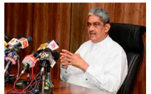
ஈஸ்டர் தாக்குதல் நடந்து ஐந்து வருடங்கள் கடந்துள்ள நிலையில், அந்தத் தாக்குதலுக்கு மூளையாகச் செயல்பட்டவர்களுக்கு இன்னமும் தலைமறைவாக உள்ளனர்.

இந்த விபத்து தென்னிலங்கையில் பெரும் அதிர்ச்சியையும் சோகத்தையும் ஏற்படுத்தியுள்ளது. கார் பந்தயம் மறு அறிவித்தல் வரை ஒத்திவைக்கப்பட்டுள்ளது. (ஐ)