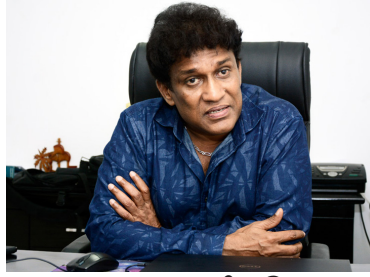
தமது அரசாங்கத்தில் இணைந்து கொள்ளுமாறு அழைப்பு விடுத்துள்ளார்-என்றார்.

சஜித் முன்னணி வகிப்பார். மேலும், எதிர்வரும் தேர்தலில் எந்த வேட்பாளர் ஜனாதிபதியாக வேண்டும் என்பதனை மக்கள் தீர்மானிப்பார்கள். நாட்டின் பிரதான கட்சிகளில் ஒன்றான தேசிய மக்கள் சக்தியின் தலைவர் அனுரகுமார் வும் எம் மீது நம்பிக்கை கொண்டு