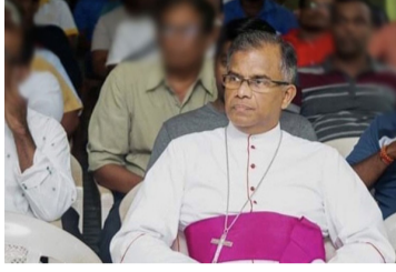
மாக அமைந்துள்ளது. சந்தர்ப்பத்தை சரியாக பயன்படுத்த வேண்டும் என்றும் அவர் கூறினார். (ஐ)

டவாறு கூறினார். ஒற்றுமையோடு ஒரு கோட்பாட்டுக்குள் பயணிப்பதற்கு தமிழ் பொது வேட்பாளர் என்ற விடயம் ஒரு சிறந்த சந்தர்ப்பம்