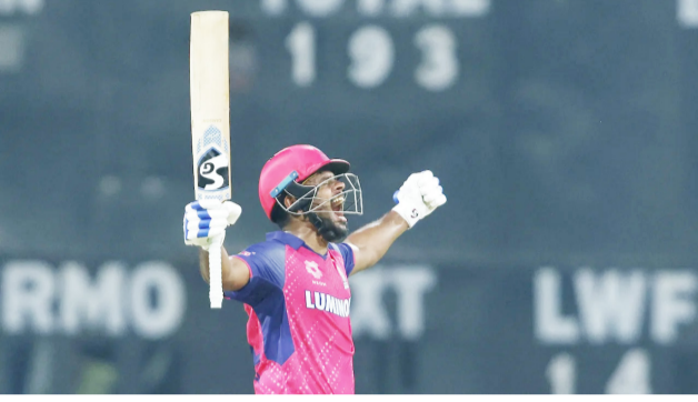
லக்னோ, ஏப். 29

லக்னோ சூப்பர் ஜெயண்ட்ஸ் அணிக்கு எதிரான ஐ. பி. எல். ஆட்டத்தில் ராஜஸ்தான் ரோயல்ஸ் அணி 7 விக்கெட்டுகள் வித்தியாசத்தில் வெற்றி பெற்றது.