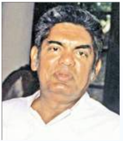
ஊழியர் நம்பிக்கைப் பொறுப்பு நிதியத்தின் ஸ்தாபகர் கால்குசென்ற அமைச்சர் லலித் அதுலத்தமுதலி