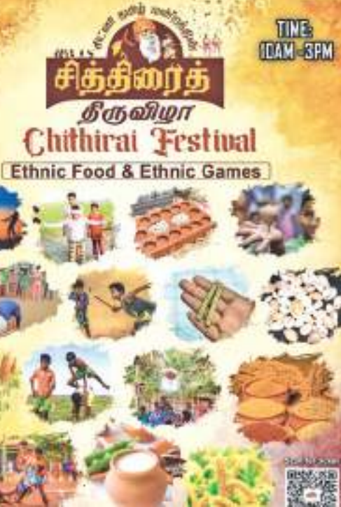
புலம்பெயர் தமிழர்களிடமும் அதன் தேற்றம் மற்றும் பாரம்பரியத்தை போற்றும் அதேவேளையில், அவுஸ்திரேலிய சமூகத்தின் ஒருங்கிணைந்த பகுதியாக இருப்பதில் பெருமை கொள்கிறது.

இலக்கியம், நாட்டுப்புற கலைகள், கலாசார விழாக்கள், இசை மற்றும் நாடகம், பாரம்பரிய நடனம் மற்றும் பாரம்பரிய இசை மூலம் தமிழ் மொழி மற்றும் கலாசாரத்தை மேம்படுத்துவதே தமிழ்ச் சங்கத்தின் முக்கிய நோக்கமாகும்.