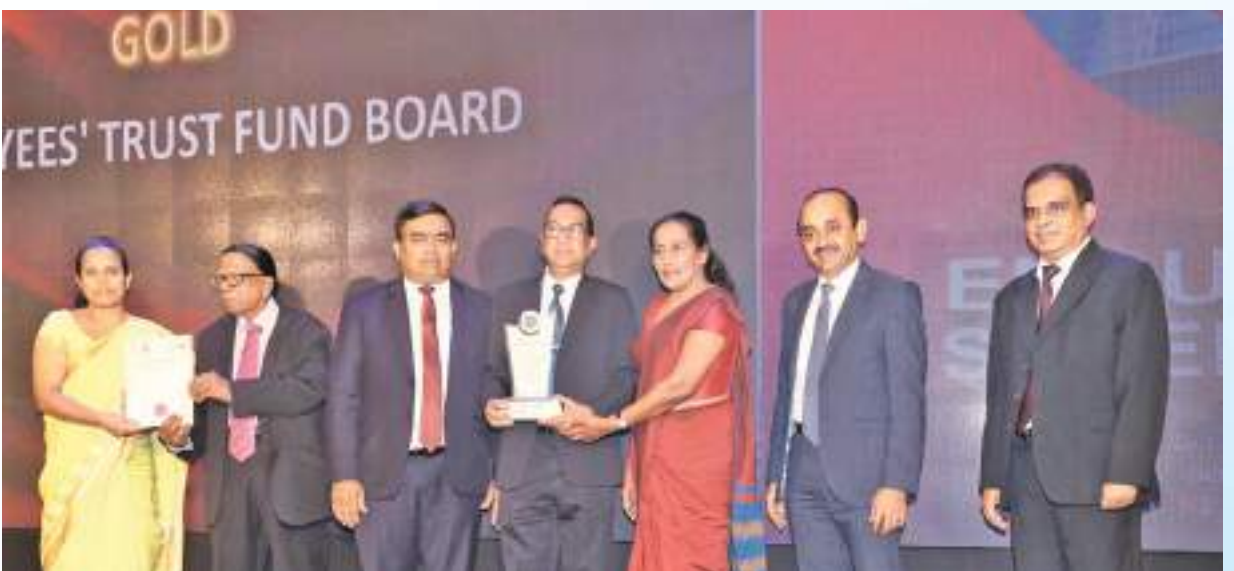
ஊழியர் நம்பிக்கைப் பொறுப்பு நிதிய சபையின் விருது விழா

1981ஆம் ஆண்டு ஆரம்பிக்கப்பட்ட ஊழியர் நம்பிக்கைப் பொறுப்பு நிதியச் சபை நிறுவப்பட்டதன் பிரதான நோக்கம் பல உள்ளன. நிதி வழங்கல் மற்றும் முதலீட்டில் பங்கேற்பதன் மூலம் ஊழியர் உரிமை, ஊழியர் நலன், பொருளாதார ஐனநாயகத்தை மேம்படுத்தல், தொழில் முயற்சியாளர்களின் சாதாரண பங்கை பெற்று முகாமைத்துவத்தில் ஊழியர் பங்கேற்பை மேம்படுத்தல், ஊழியர் ஒய்வு பெறும்போது பங்களிப்புச் செய்யாத நன்மை ஒன்றை பெற்றுக் கொள்வதற்கான ஏற்பாடுகளை செய்வது மற்றும் இந்த இலக்குகளை நிறைவேற்றுவதற்கு தேவையான மற்ற அனைத்து செயற்பாடுகள் மற்றும் விடயங்களை மேற்கொள்ளல் இந்த இலக்குகளில் இடம்பெறும்.