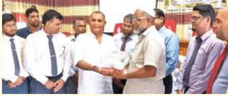
அக்கரைப்பற்று மத்திய நிருபர்

அக்கரைப்பற்று பிரதேசத்தில் குறைந்த வருமானம் பெறும் குடும்பங்களுக்கு இலவசமாக அரிசி விநியோகம் செய்யப்பட்டதுடன், மேற்படி குடும்பங்களுக்கான அரிசியை பாராளுமன்ற உறுப்பினர் ஏ.எஸ்.எம்.அதாஉல்லா வழங்கி வைத்தார். குறைந்த வருமானம் பெறும் குடும்பங்களுக்கு அரசாங்கத்தால் வழங்கப்பட்டு வரும் இலவச அரிசி விநியோகத் திட்டத்தின்