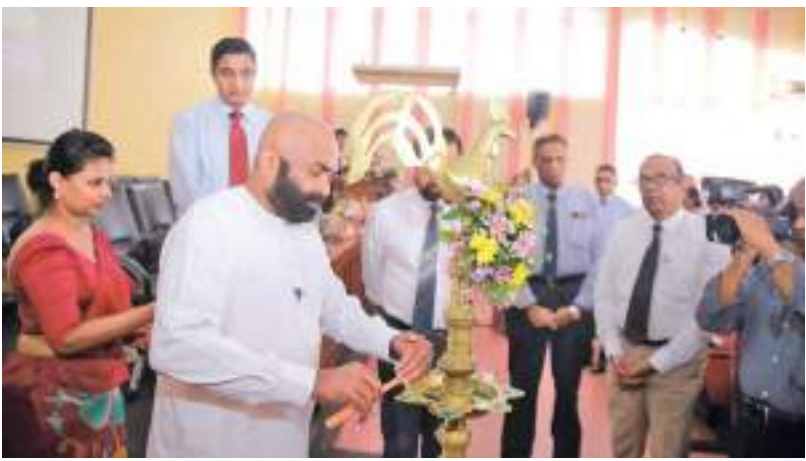
ஊழியர் நம்பிக்கைப் பொறுப்பு நிதியத்தில் இடம்பெற்ற நிகழ்வில் நிதி இராஜாங்க அமைச்சர் ரஞ்சித் சிவப்பலாபீட்டிய கலந்துகொண்டார்.

ஊழியர் சேமலாப நிதியம் போன்றல்லாது ஊழியர் நம்பிக்கைப் பொறுப்பு நிதியத்தின் பங்களிப்புத் தொகையை செலுத்துவதற்கு முன்னர் பதிவு செய்யும் நடைமுறை ஒன்று இல்லை. வர்த்தகம் ஒன்று ஆரம்பிக்கப்பட்டு முதல் ஊழியரை பணியமர்த்தும் ஒரு தொழில் வழங்குநரின் முதலாவது மற்றும் பிரதானமான பொறுப்பு தொழில் ஆணையாளர் நாயக்கத்தின் கீழ் பதிவு செய்து அந்த ஊழியருக்காக பதிவு இலக்கம் ஒன்றை பெற்றுக்கொள்வதாகும். தொழில் திணைக்களத்தின் பதிவு இலக்கம் கிடைத்த பின் நிதியத்திற்கு கார்டு பன்னாட்டு வகை மூலம் மற்றும் ஆலோசனைகளை பெற்றுக்கொள்ளும் நோக்கில் தொழில் வழங்குநரால் ஊழியர் நம்பிக்கைப் பொறுப்பு நிதியச் சபை அலுவலகத்திற்கு எழுத்து மூலம் அது தொடர்பில் அறிவிப்பது அல்லது தனிப்பட்ட முறையில் அந்த அலுவலகத்திற்கு செல்லல் வேண்டும். ஊழியர் நம்பிக்கைப் பொறுப்பு நிதியச் சபைக்கு முதல் பங்களிப்புத் தொகை கிடைத்த பின் அந்த தொழில் வழங்குநர் நிதியத்தின் பங்களிப்புத் தொகையை செலுத்துகின்ற தொழில் வழங்குநரின் பட்டியலுக்கு உள்ளடக்கப்படும். அங்கீகரிக்கப்பட்ட சேமலாப நிதியங்களுக்கு பங்களிப்புத் தொகையை செலுத்துகின்ற ஊழியர்களுக்காக ஊழியர் நம்பிக்கைப் பொறுப்பு நிதியத்தினால் வேறாக இலக்கம் ஒன்று பெற்றுத் தரப்படும். அவ்வாறான ஊழியர்களினால் அந்த இலக்கம் அனைத்து மாதந்தம் கொடுப்பனவு படிவங்களில் அறையணை அறிக்கைகளில் மற்றும் மற்ற ஆவணங்களில் குறிப்பிடுதல் வேண்டும்.