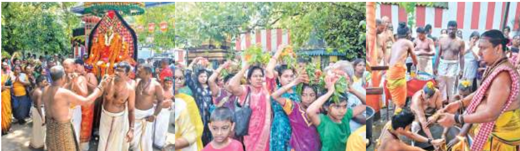
இந்துசமய கலாசார அலுவல்கள் திணைக்களத்தின் கீழ் இயங்கும் பாணந்துறை அருள்மிகு ஸ்ரீ கந்தசுவாமி ஆலயத்தின் வருடாந்த மஹோற்சவ திருவிழா அண்மையில் இடம்பெற்றது. இங்கு இடம்பெற்ற தீர்த்தோற்சவ நிகழ்வின் போது சுவாமி தீர்த்தோற்சவம் கான எழுந்தருளி வருவதனையும் பக்தர்களின் பாற்குடவணி இடம்பெறுவதனையும் படங்களில் காணலாம்.