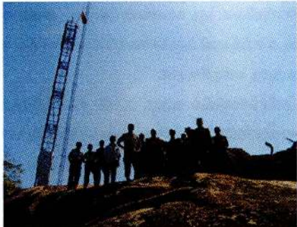
සිලාලේඛන පිටපත් කිරීම සඳහා සහභාගි වූ පිරිස්

මෙවැනි පුරාවිද්‍යාත්මක ස්ථානයක් හඳුනා ගැනීම සඳහා කටයුතු කළ ආරක්ෂක අංශ නිලධාරීන්ට පුරාවිද්‍යා දෙපාර්තමේන්තුවේ ස්තුතිය හිමිවිය යුතුම යි එසේ ම මෙම සෙල්ලිපි පිළිබඳව දැනුම්දීමේ දී සේරුවිල රජමහා විහාරයේ නායක පුජ්‍ය සේරුවිල සරණකිත්ති ස්වාමීන් වහන්සේටත් අතිපුජ්‍ය එල්ලාවල මේධානන්ද නායක ස්වාමීන් වහන්සේටත් පුරාවිද්‍යා නිලධාරී රංජිත් සැමසන් මහතාටත් කෘතඥ පූර්වක ස්තුතිය පිරිනමනු ලැබේ.