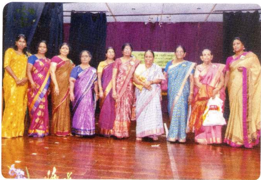
பாடசாலையின் பாசமிகு பழைய மாணவிகளின் ஒரு பகுதினர்.