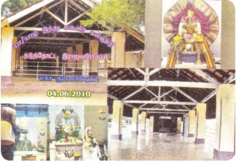
யாழ்/ இந்து மகளிர் கல்லூரி வளாகத்தில் அமைந்த இராஜவரோதய பிள்ளையார் ஆலயம்.