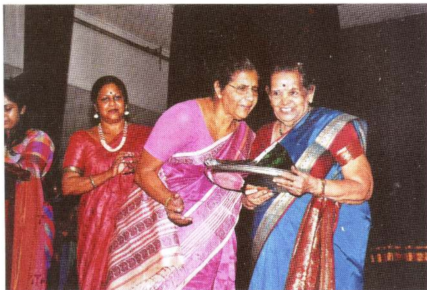
மன்றத் தலைவியும், யாழ்நாதம் நூலாசிரியையும், காரியதரிசியுடன்.