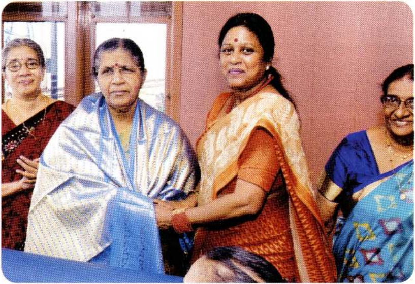
எமது மன்றத் தலைவி கௌரவிக்கப்படுகின்றார்.