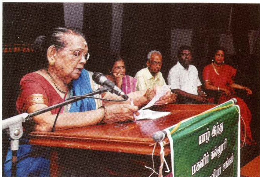
நன்றியுரை வழங்குகிறார் நூலாசிரியர்.