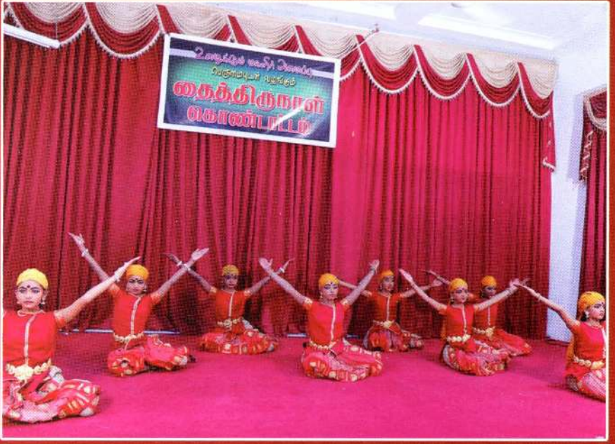
யாழ்/ இந்து மகளிர் கல்லூரி மாணவிகளின் நடன நிகழ்ச்சி