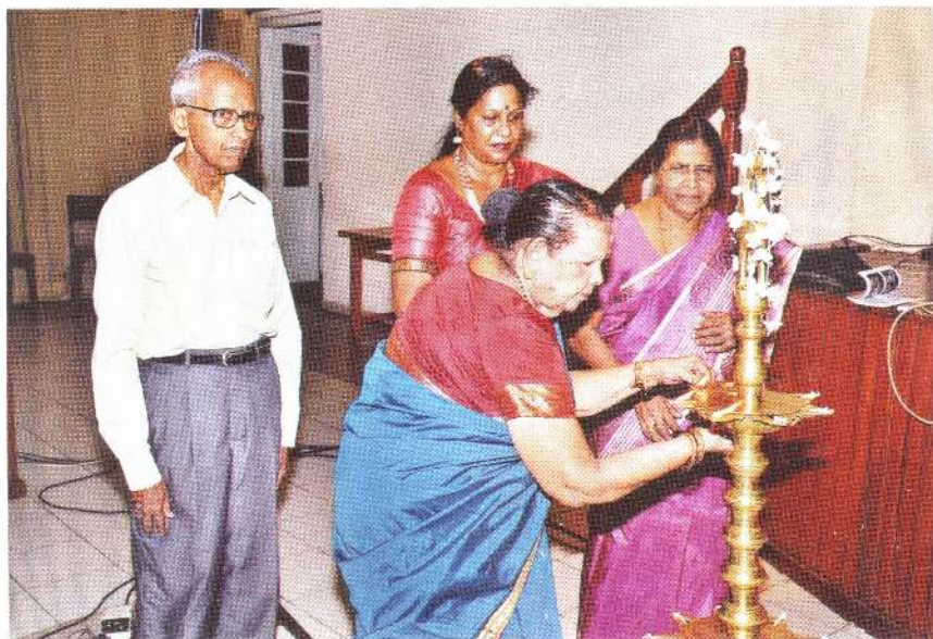
மங்கள் விளக்கேற்றல் - யாழ் நாதம் நூலாசிரியர்.