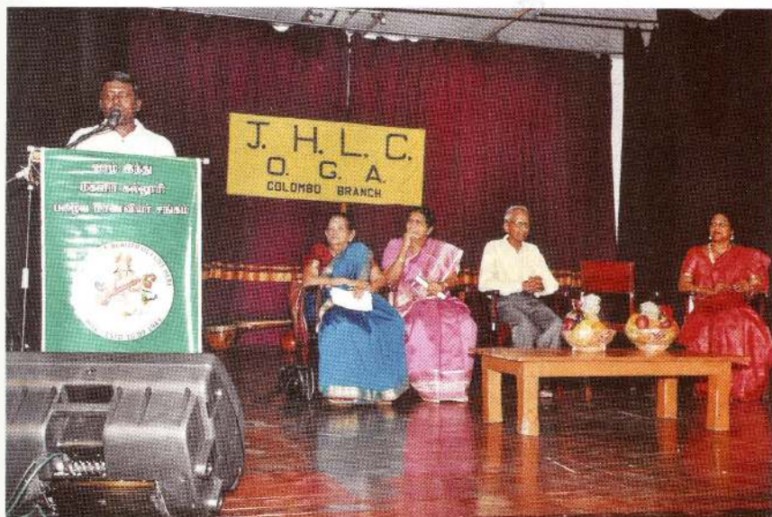
விசேட விருந்தினர் உரையாற்றுகிறார்.