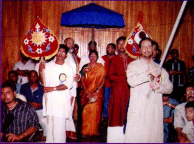
கம்பன் புகழ் விருது: மேடைக்கு அழைத்து வருவதற்கு தயாராக இருக்கும்போது குறிப்பு பக்கம் 7