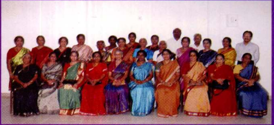
வருடாந்த ஒன்று கூடல் நிகழ்வு. குறிப்பு பக்கம் 52