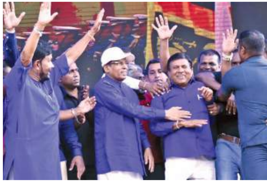
ஸ்ரீல.க.கட்சியின் மே தின நிகழ்வு நேற்று கம்பஹாவில் நடைபெற்றது. இந்நிகழ்வில் முன்னாள் ஜனாதிபதி மைத்திரிபால சிறிசேன உட்பட கட்சி உறுப்பினர்கள் கலந்துகொண்டுள்ளதை படத்தில் காணலாம்.