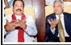
ஜனாதிபதித் தேர்தலில் ரணில் விக்கிரமசிங்கவுக்கு ஆதரவு வழங்குவது 06