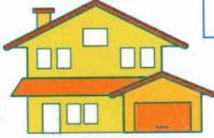
குடியிருப்பாளர் / வரி முகவர்