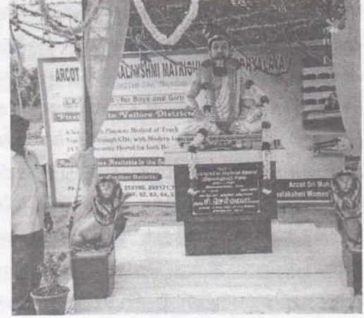
திருவள்ளுவர் சிலையும் திறந்து வைத்த உறுதிசெய்யும் கற்பலகையையும் கானலாம்