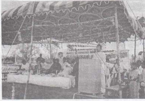
புதுவைக்கிளைக் கூட்டத்தில் அகிலத்தலைவர் அவர்கள் பேசும் போது.