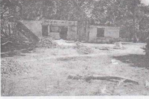
முல்லைத்தீவில் சூனாமியால் அழிந்த கட்டடங்களில் சில