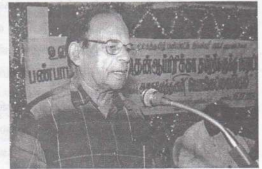
புதுவைக்கிளைக் கூட்டத்தில் அகிலத்தலைவர் அவர்கள் உரையாற்றுகிறார்