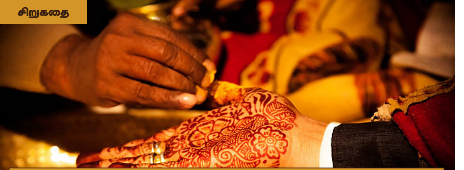
அஷ்ட-ஷெய்க் முபர்ரிஜ் (நுளீமி)