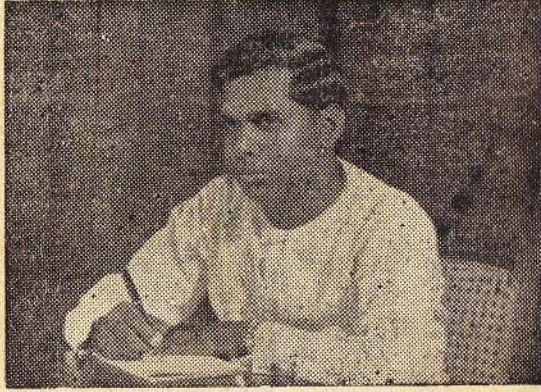
கௌரவ ஆசிரியர்: மு. க. சுப்பிரமணியம்